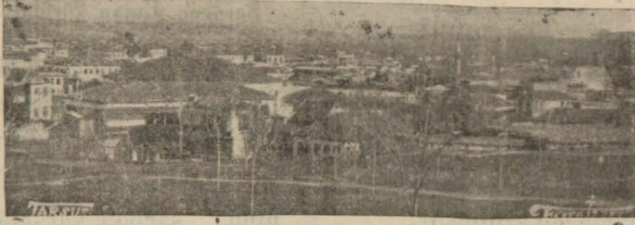
Sayım işleri önemle güdülen Tarsustan bir görünüş

Gilindire nahiyesine elli evli göçmen çağırıldı